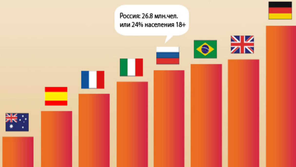
Число пользователей Интернета в странах